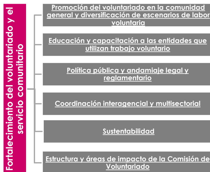
Figura 2: Componentes del Plan

La información recopilada a través de estos métodos de investigación y alcance, permitió identificar áreas de necesidad y aspectos necesarios a fortalecer en el movimiento de voluntariado, a su vez, permitió definir las áreas temáticas o componentes de este plan. Estas fueron las siguientes: